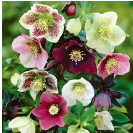
Helleborus of Kerstroos

Beste Neos-vrienden, zoals u ziet hoeft onze tuin niet kleur- en troosteloos te zijn in deze donkere wintermaanden. Een beetje kleur in onze tuin brengt ook wat fleur in ons hart. Eén van de vele lichtpuntjes die alles weer een beetje mooier maken, dit is de voorbode van de lente. Een lente die heel anders zal verlopen dan deze van het voorgaande jaar, het vaccinatieprogramma komt stilaan opgang en effent het pad naar een normaler leven, waar we weer kunnen samenkomen, wandelen, fietsen, bowlen, dansen, daguitstapjes maken en reizen.