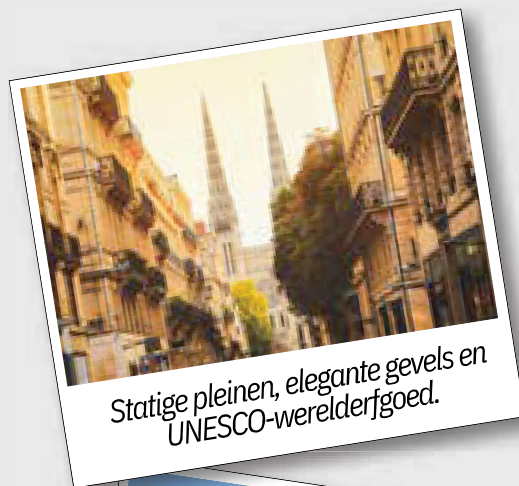
Statige pleinen, elegante gevels en UNESCO-werelderfgoed.

Ontscheping en terugreis naar België met vrije lunch onderweg.