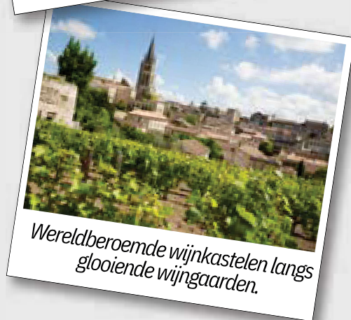
Wereldberoemde wijnkastelen langs glooiende wijngaarden.